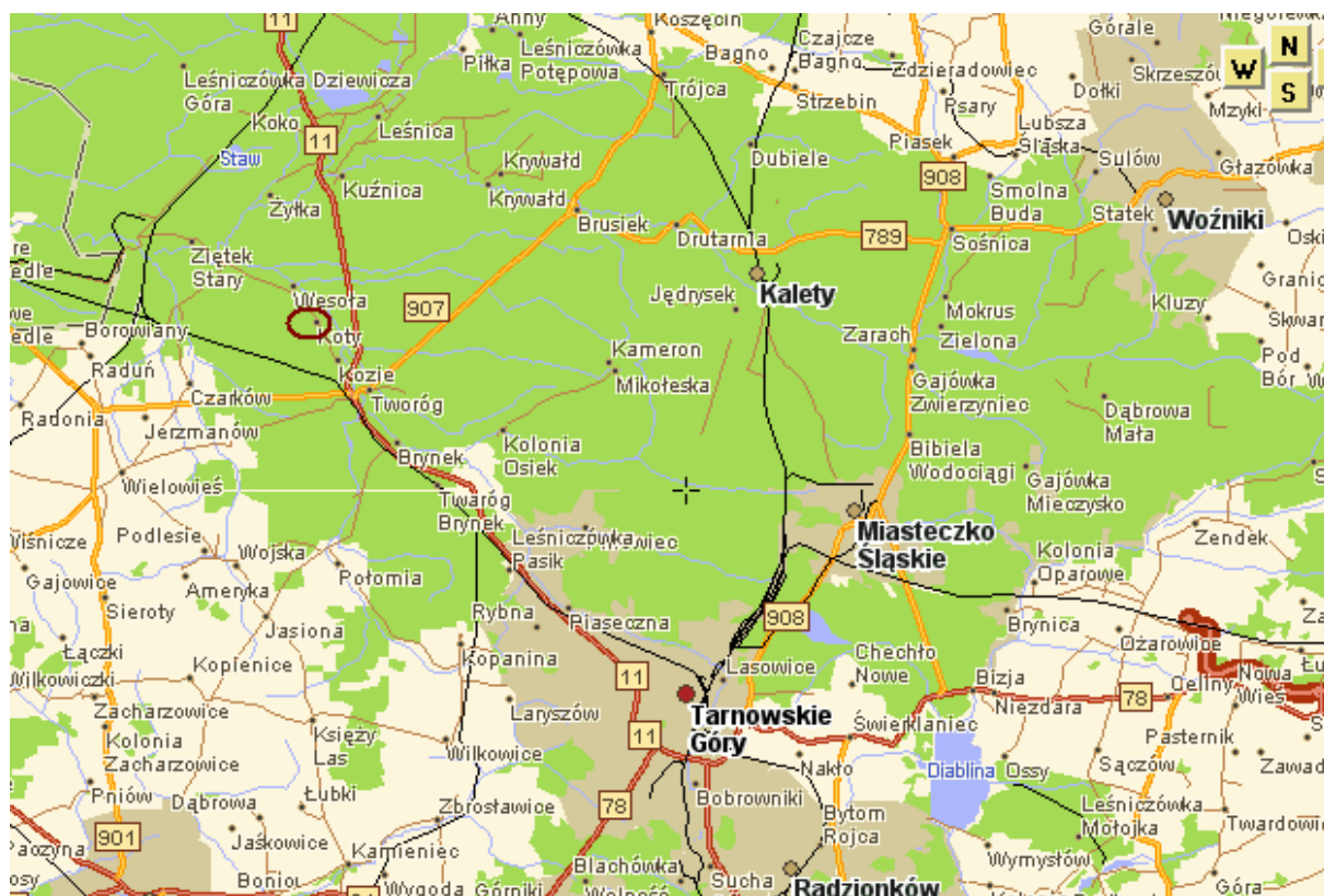
Rysunek 1. Umiejscowienie wsi na mapie drogowej

Gmina zajmuje powierzchnię 12 492 ha, z czego 2 360,47 stanowi powierzchnia miejscowości Koty.