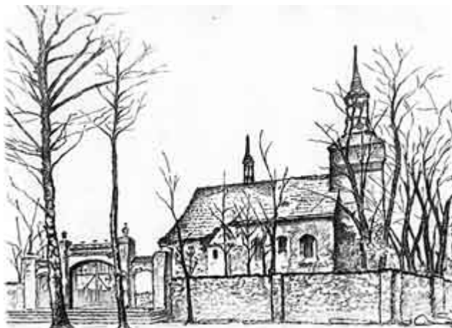
Rysunek 5. Kościół Rzymsko Katolicki p/w św. Piotra i Pawła - grafika