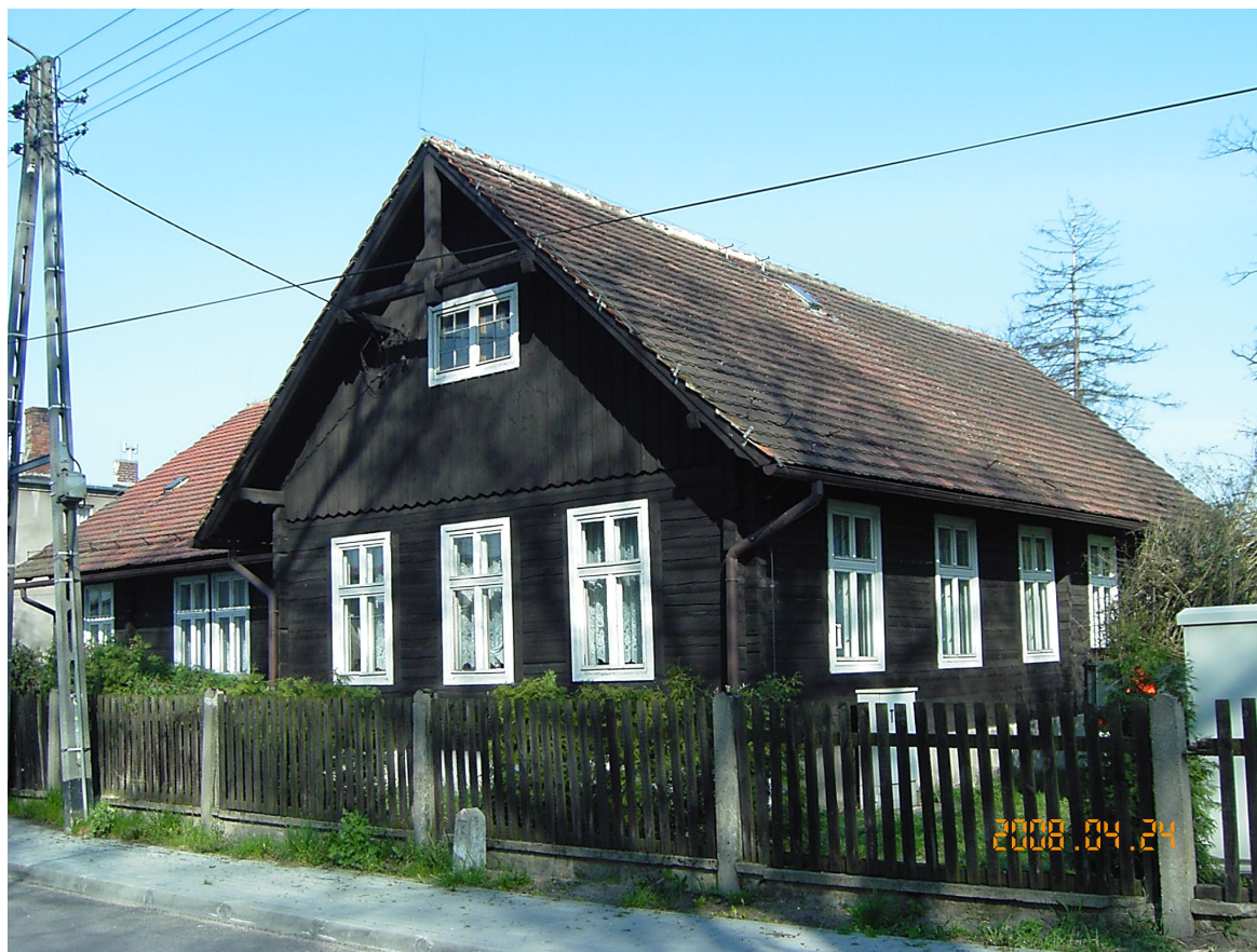
Przedszkole w Kotach.

Na terenie miejscowości działa Klub sportowy LKS Orzeł Koty, zajmujący się rozgrywkami piłki nożnej (klasa A). Funkcjonuje boisko piłkarskie, boisko do koszykówki, kort tenisowy, plac zabaw.