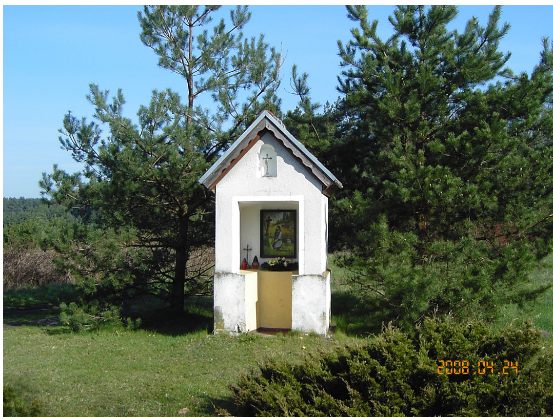
Rysunek 6. Kapliczki w miejscowości Koty

Największym bogactwem miejscowości Koty są okoliczne lasy, w których obficie występują grzyby i owoce leśne. Z naturalnego bogactwa gminy korzysta wielu turystów przyjeżdżających tu z terenu całego kraju oraz zagranicy.