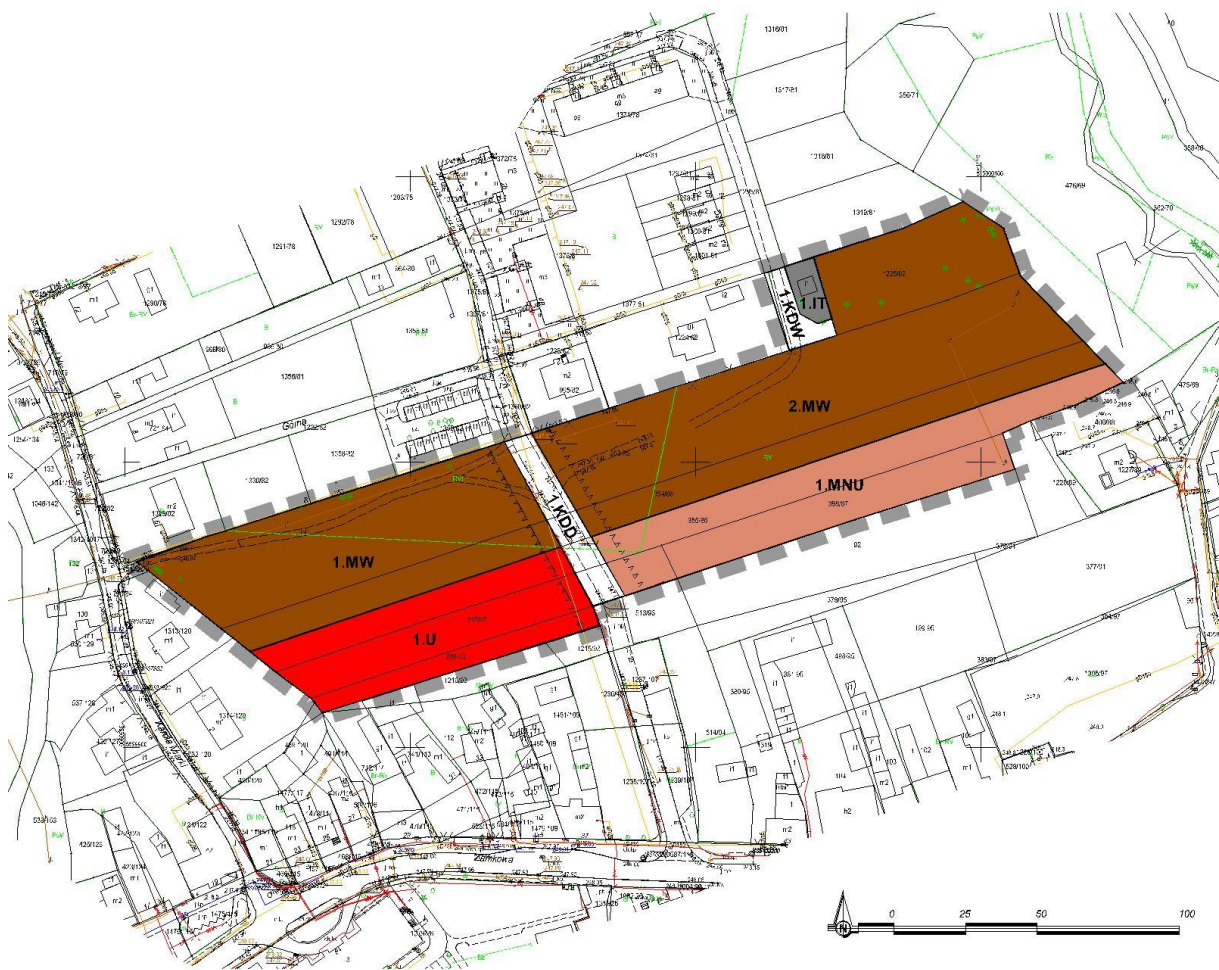
Rys.3 Rysunek projektu planu (pomniejszenie bezskalne):

Obecnie na obszarze opracowania obowiązuje miejscowy plan zagospodarowania przestrzennego Gminy Tworóg w sołectwie Brynek i Tworóg, przyjęty uchwałą nr XLIX/525/2010 Rady Gminy Tworóg z dnia 25 stycznia 2010 r. Duża część ustaleń z obowiązującego planu, w szczególności w zakresie przeznaczeń podstawowych została w projekcie planu utrzymana.