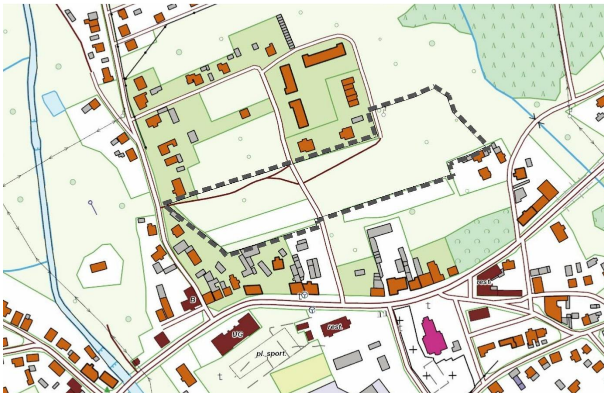
Rys 3. Ortofotomapa obszaru objętego projektem planu miejscowego.