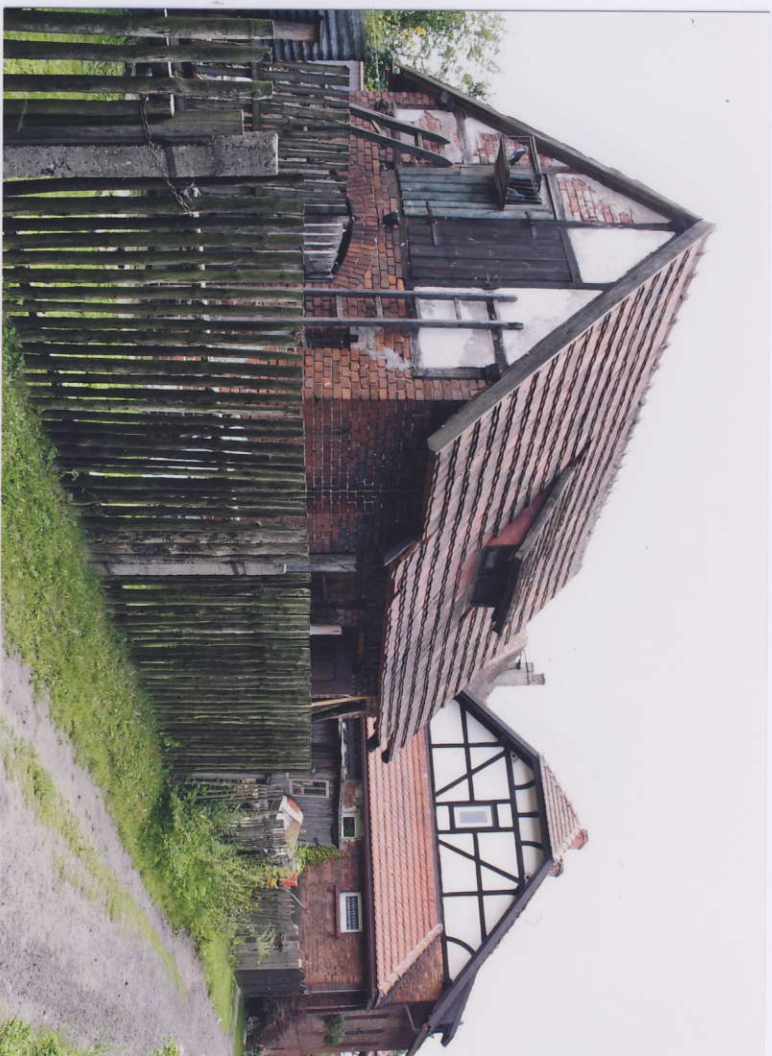
Widok od północnego-wschodu