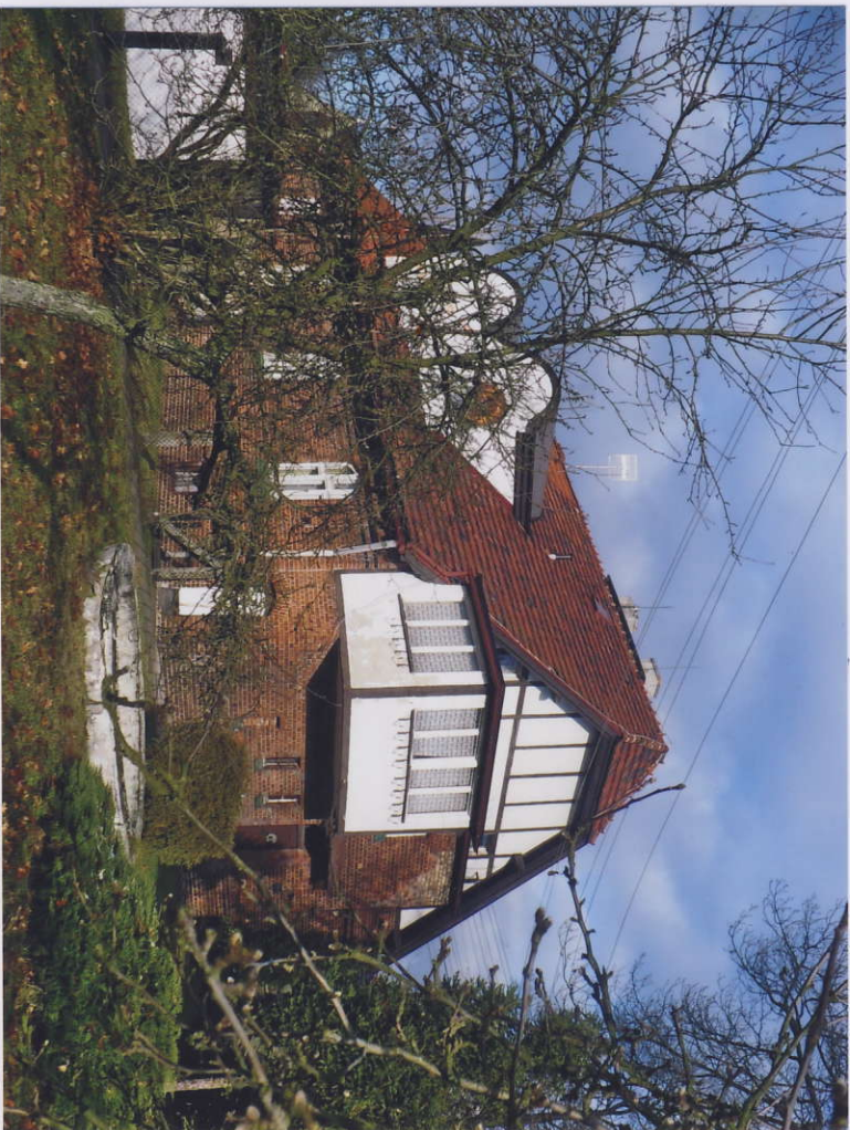
Widok od południowo-zachodu