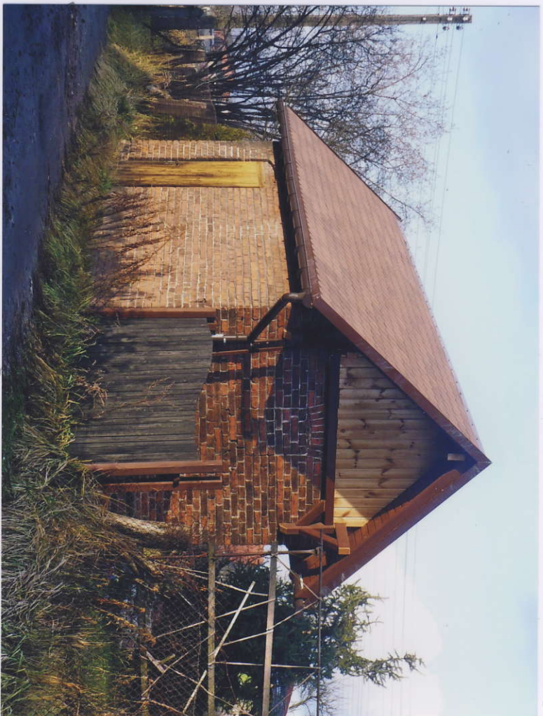
Budynnek gospodarczy, widok od południowo-zachodu