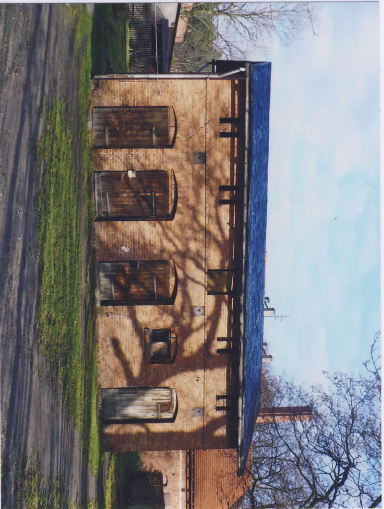
Budynek gospodarczy, widok od południowo-zachodu